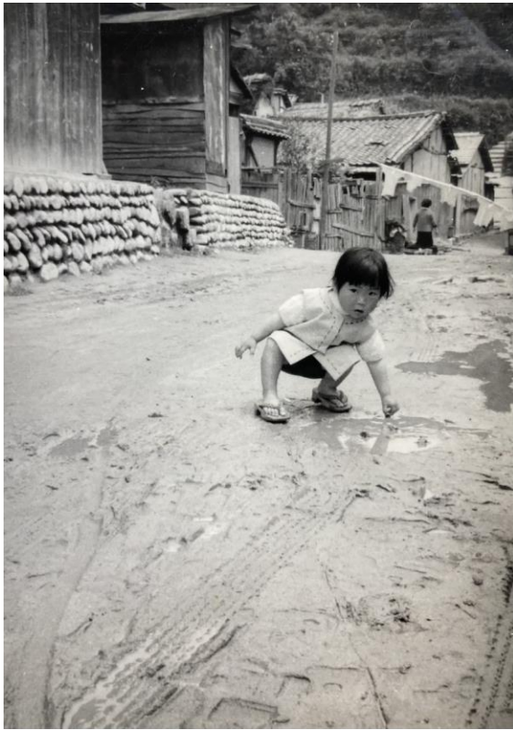
3 際頃の写真で、後ろ左に写っているのが 藤原タオルの工場

つぎに、ダンスとの出会いである。体育の授業で創作ダンスを踊る機会があり、グループになって踊った際に、先生がそのパフォーマンスに舌を巻き、クラスメイトの前でたいへん褒めてくれた。この経験から藤原氏は踊ることが大好きになった。のちほど大人になってからフラ hula に魅了されるが、藤原氏の舞踊の原点はここにある。