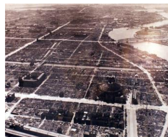
空襲後の東京

しかし、平成時代にも大きな試練が日本を待ち受けていました。 阪神・淡路大震災や東日本大震災をはじめとする大きな地震や今まで経験したことのない規模の集中豪雨やそれにと ともなう大洪水など、いくつもの大きな自然災害が発生しました。特に東日本大震災での津波による恐ろしい光景に、日 本だけでなく世界中の人々が自然の驚異を思い知らされました。災害が発生するたびに被災者は絶望的になり、その光景 を目の当たりにした人も被災者を思って、不安な気持ちや悲しい思いに胸を痛めました。