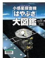
『小惑星探査機「はやぶさ」大図鑑』 川口淳一郎 監修 2012年 池下章裕 CG 偕成社