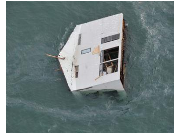
津波で太平洋上を漂う家屋

『こども10大ニュース 1989』 こどもニュース研究会 編 メグ・ホソキ 絵 国土社 1995年