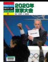
『2020年東京大会 時代背景から考える日本の 6つのオリンピック3』 稲葉茂勝 文 大熊廣明 監修 ベースボールマガジン社 2015年

昭和の人々を元気にした東京オリンピック。2020年の開催決定に日本中が大興奮。平成の人々に夢と希望と目標をくれました。