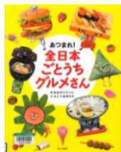
『あつまれ! 全日本 ごとうちグルメさん』 ふくべあきひろ 文 おおのこうへい 絵 ブロンズ新社 2011年