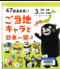
『47都道府県!! 3 ご当地キャラと日本一周3』 ご当地キャラ探検隊 編著 汐文社 2013年