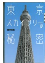
『東京スカイツリー の秘密』 瀧井宏臣 著 椎野充 写真 講談社 2012年

「東京スカイツリー」に、小惑星探査機「はやぶさ」などなど… 昭和に負けず劣らず、平成もモノづくり大国ニッポンにあっばれ!