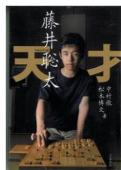
『天才藤井聡太』 中村徹 著 石川啓次 写真 文藝春秋 2017年

様々な分野で、平成生まれの若い人たちの活躍が目立ちました。これらを担う若者たちの活躍は、日本を元気にしてくれました。