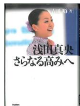
『浅田真央 さらなる高みへ』 吉田順 著 菅原正治 写真 学研 2011年