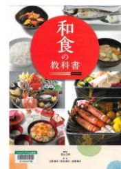
『和食の教科書』 足立己幸 著 2016年 齋藤いづみ 装丁 文溪堂

世界の人々からも評価が高い「和食」。食は元気の源。しっかり食べて、さらにパワーアップ!